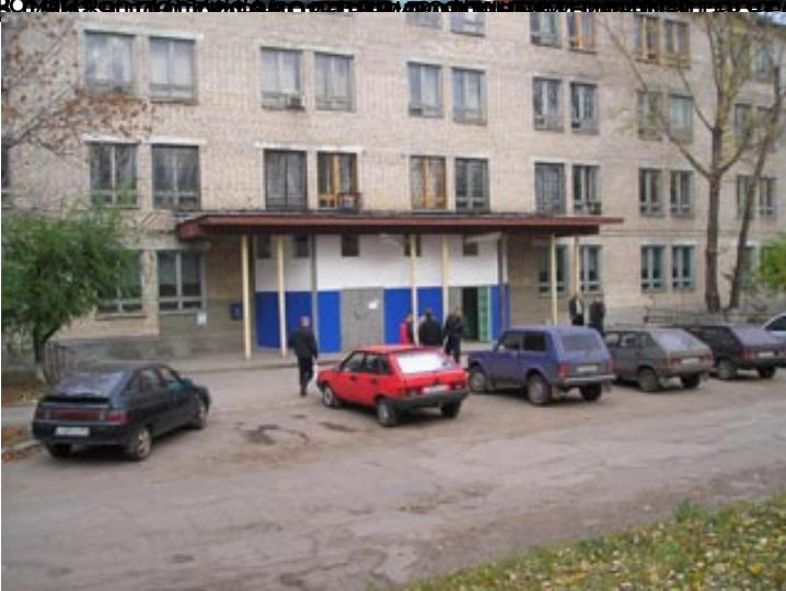
В 1995 году колледж переходит в ведение областного управления образования. При этом вводится новое название – Колледж имени Сергея Есенина.