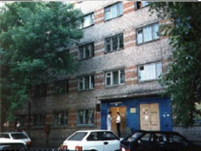
В 1982 году на территории бывшего завода «Титан» в поселке Давыдовское создается филиал областного колледжа.